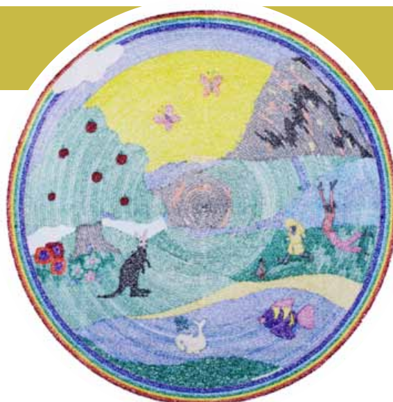
Gratitud a los animales