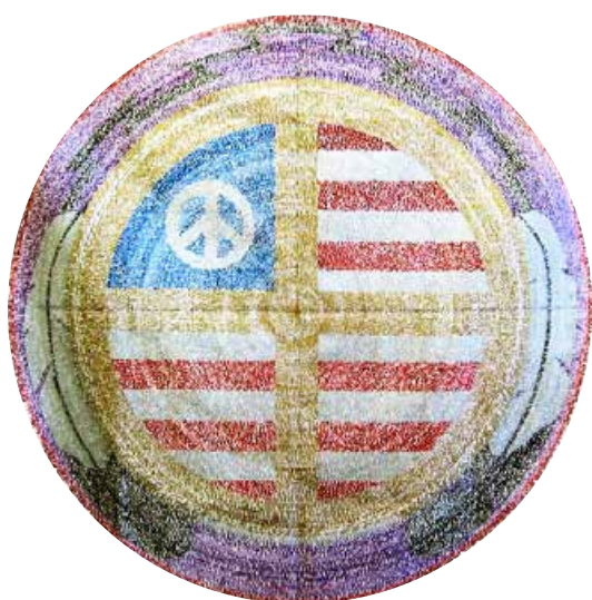
En el año 2004, se realizó un taller de mandalas con los internos de una prisión en los Estados Unidos. Como parte del taller, los participantes crearon este mandala colectivo.