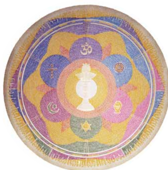
Este mandala contiene los símbolos sagrados de las seis religiones más numerosas.