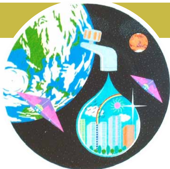
Gratitud al agua