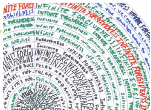
“Infinite Perdón” (Japón)