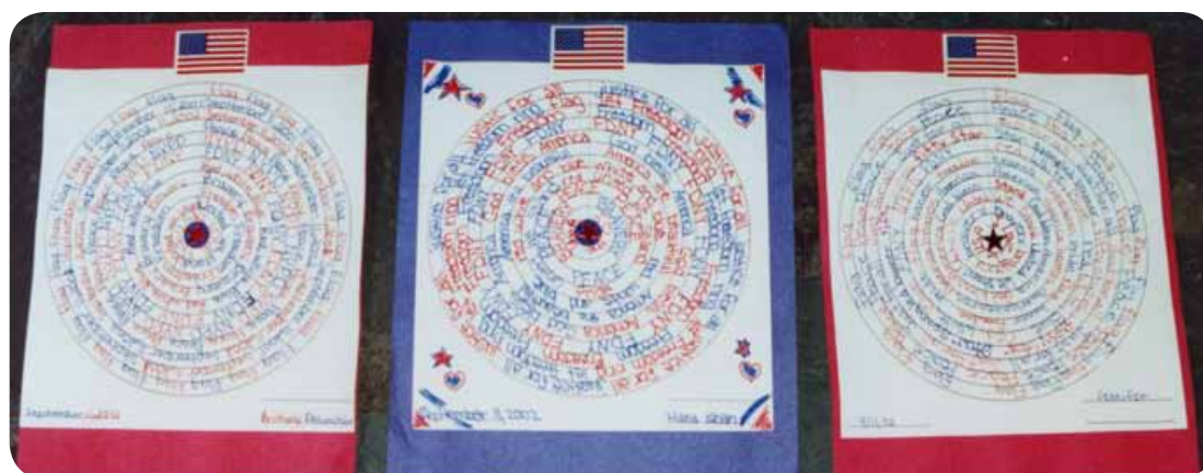
Mandala realizado por estudiantes de una escuela de USA, sobre los incidentes del 11 de Septiembre 2001.