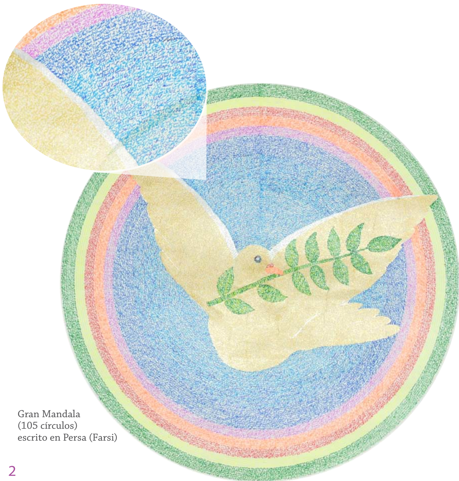
Gran Mandala (105 círculos) escrito en Persa (Farsi)

Un mandala escrito está realizado con un número de círculos concéntricos, dentro de los cuales se escriben palabras brillantes, positivas y significativas. A medida que escribimos palabras de amor, gratitud, paz y armonía, el poder de esas palabras se vierte en el mandala. El proceso de escribir las palabras nos sana y nos revitaliza. Cuando el mandala está completo, continúa irradiando constantemente esta energía sanadora hacia la humanidad y el mundo de la naturaleza.