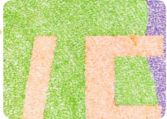
“Infinite amor” (Irán)