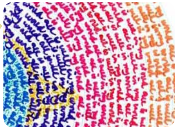
“Todo esta bien en el mundo” (Filipinas)